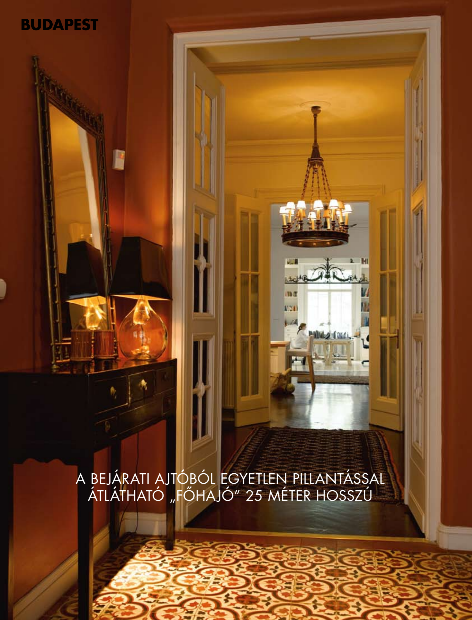
A BEJÁRATI AJTÓBÓL EGYETLEN PILLANTÁSSAL ÁTLÁTHATÓ „FŐHAJÓ” 25 MÉTER HOSSZÚ