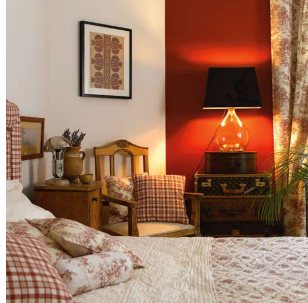
A vendégszobában a toile és kockás mintás textilek színét alkalmazták a falon is. Az előszobaszekrény a Ludovikából származik (balra lent), házilag pingálták egyedire. Mozaik és kő burkolja a fürdőszobát (lent)